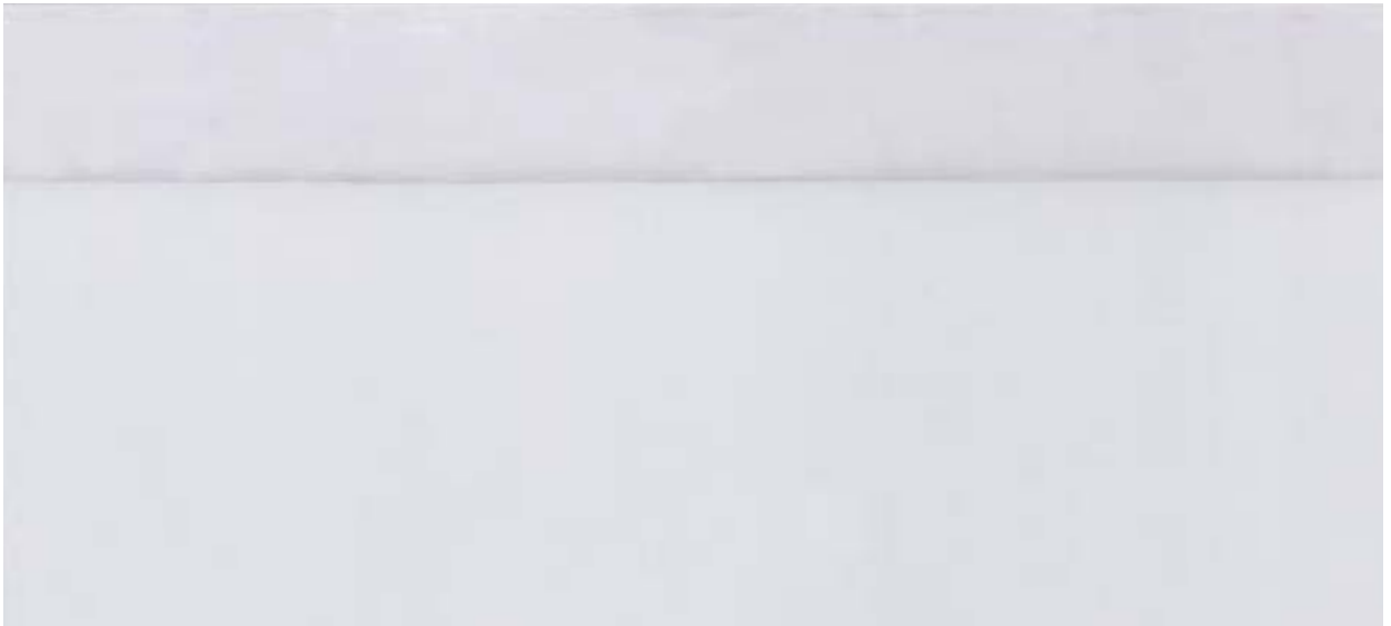
6148 CRISTALPLUS 650 3S