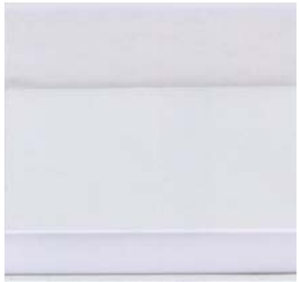
6026 CRISTALPLUS WINDOW 500 2S