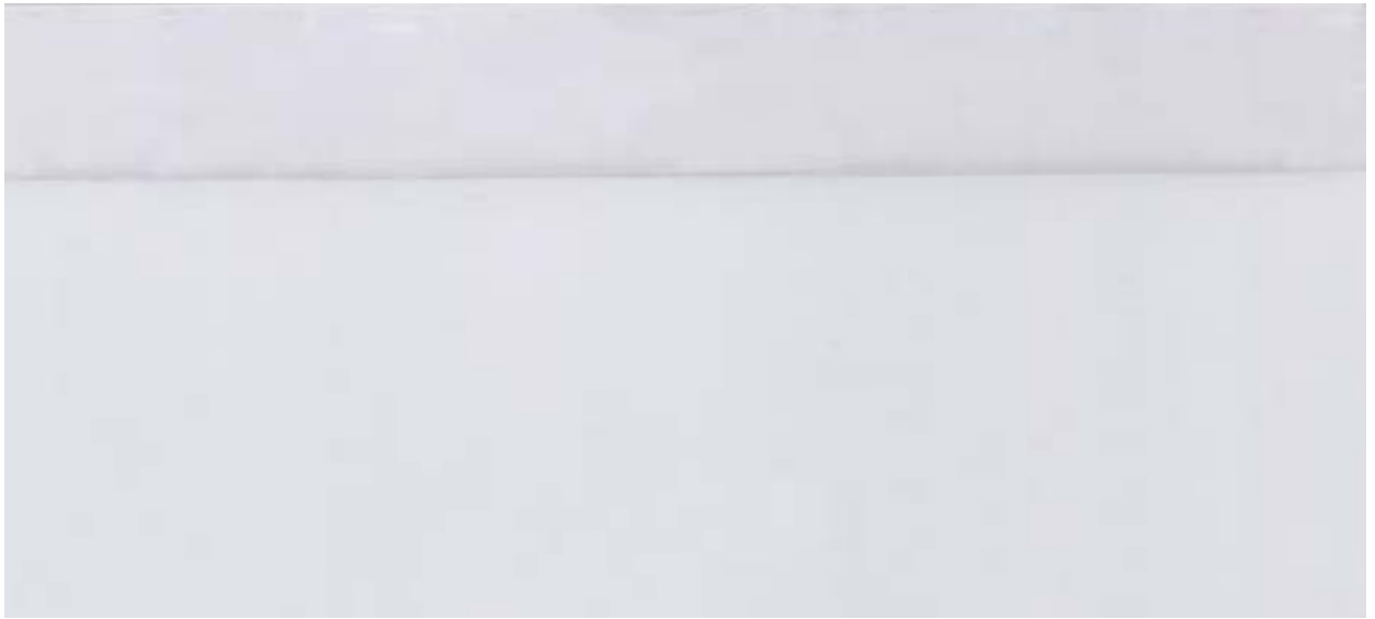
8707 CRISTALPLUS 500 1S