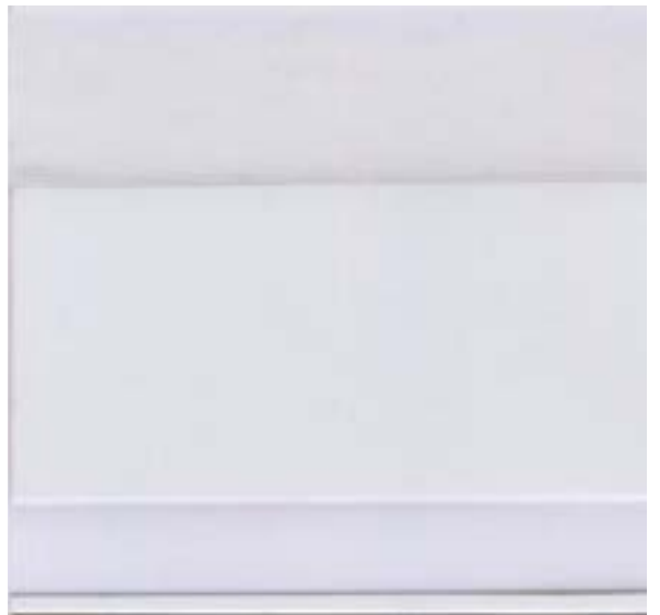
6026 CRISTALPLUS WINDOW 500 2S